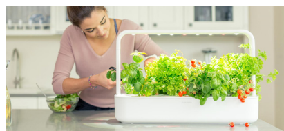
7 De smart garden