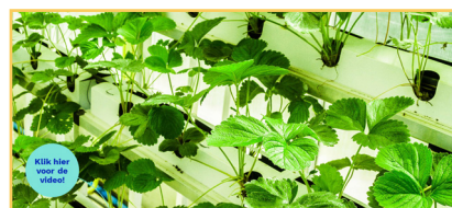
8 Video vertical farming