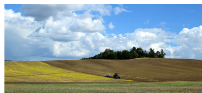
6 Wat heeft een plant nodig om te groeien?