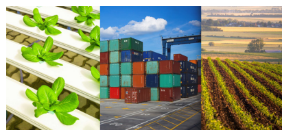
9 Wat zijn de voor- en nadelen?